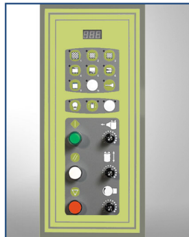
Przejrzysty panel do obsługi