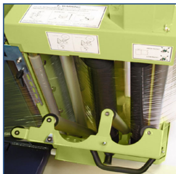
Bezpieczne zakładanie folii między rolki